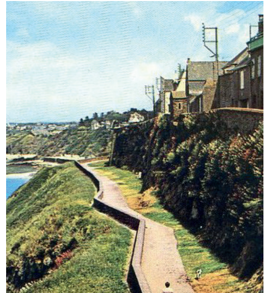
Die Stadtmauern von Granville

Das Unternehmen French Lines & Compagnies beauftragte Arkhênum mit der Durchführung verschiedener Digitalisierungen: Hefte im Jahr 2011, Glasplatten im Jahr 2013 und Poster im Jahr 2021. Diese Einrichtung in Le Havre bewahrt, valorisiert und verbreitet die Geschichte der französischen Handelsmarine, einschließlich der historischen Bestände von Unternehmen wie der Confédération Générale du Travail (CGT), den Messageries Maritimes und der Société Nationale Maritime Corse-Méditerranée (SNMCM).