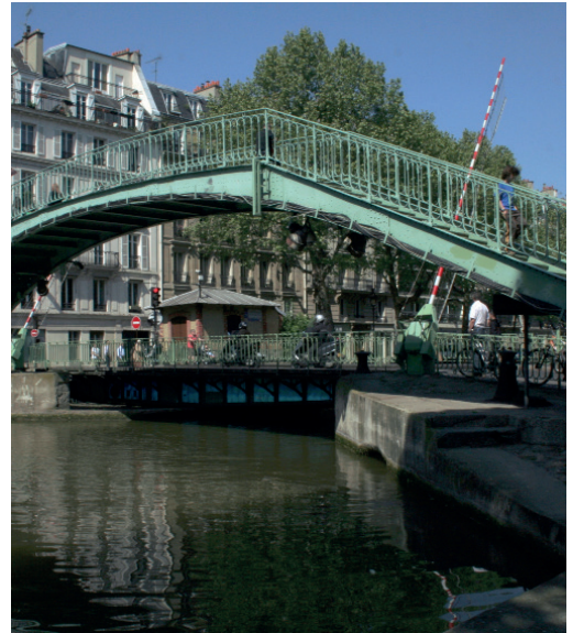
Die Alibert-Brücke © Coyau

Zuletzt wurde TRIBVN Imaging gebeten, wertvolle historische Karten des IRFA zu bewahren. Die Experten digitalisierten rund 60 Pläne, Karten und Skizzen aus Asien, die aus dem späten 19. und 20.